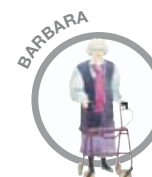
B Barbara Er delvis selvhjulpen, Bruger rollator eller lignende