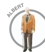
A Albert Er selvhjulpen, Bruger eventuelt et enkelt ganghjælpemiddel