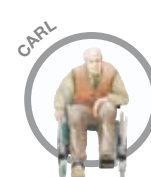
C Carl Kan klare nogle få ting selv. Sidder i kørestol – kan delvist støtte på mindst et ben